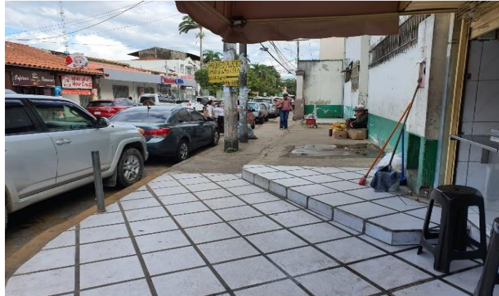
Vista del lugar de emplazamiento desde la esquina