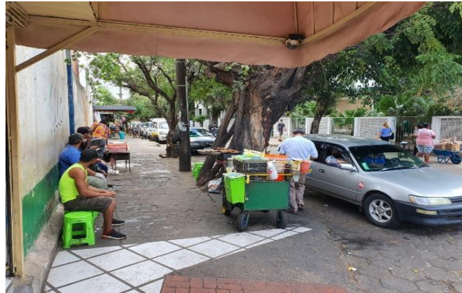
Vista de la acera de la calle Rafael Peña