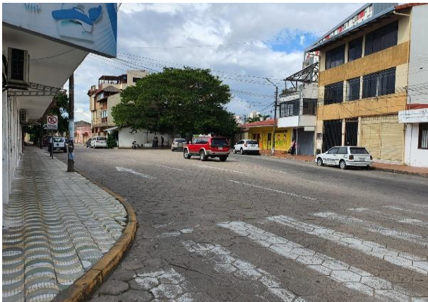
Vista de la intersección

Se pudo observar en diferentes visitas al lugar, que en ciertos horarios como el ingreso del colegio cercano o al medio día, el espacio es utilizado como parqueo temporal. Este abuso del espacio público debe ser combatido por que comienza así la privatización del espacio de todos por unos pocos que se sirven de el.