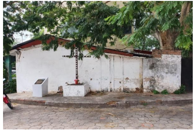
Cruz conservada en el lugar